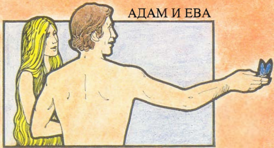
ВРЕМЯ НЕПОРОЧНОСТИ БЫТИЕ 2:25